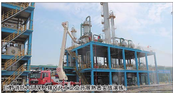
巨野消防大队深入辖区化工企业开展熟悉实战演练。

演练假设盐酸罐发生泄漏,企业管理人员发现后第一时间组织人员疏散,启动应急预案,并拨打报警电话。消防队接到报警后迅速赶赴现场“救援”。当消防队员们抵达现场时发现,现场已被白烟笼罩,指挥员立即组织人员扩大现场警戒范围,并第一时间出两支水枪,对泄露区域进行稀释。经询问了解,泄漏部位为生产车间,指挥员立即组织人员进入现场进行检测,经侦查发现泄漏部位为氟化氢管道法兰