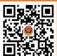
菏泽消防微博二维码