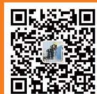
菏泽消防官方微信二维码