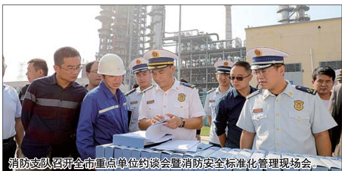
消防支队召开全市重点单位约谈会暨消防安全标准化管理现场会。

现场会分为实地观摩和经验交流两部分。与会人员先后观摩了菏泽万达广场商业管理有限公司、山东玉皇盛世化工股份有限公司消防安全标准化管理现场。在万达广场,参观了消防文化体验馆,针对单位内部防火巡查、检查等进行示范性演示,并就消防控制室达标建设、利用物防技防措施提高单位安全管理水平、微型消防站灾情处置等进行现场演示。在玉皇盛世化工有限公司,重点介绍企业消防安全主体责任落实,并在参观厂区标识化管理后,模拟装置泄露,观摩企业专职消防队、工艺处置队协同进行现场应急情况