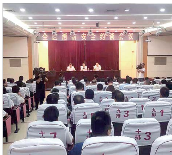
牡丹区政府召开全区消防安全约谈会议。

格按照演练步骤,相互协同配合,及时化解险情。进一步提高了全体指战员对危化品专业应急处置能力,为今后处置类似事故打下基础。