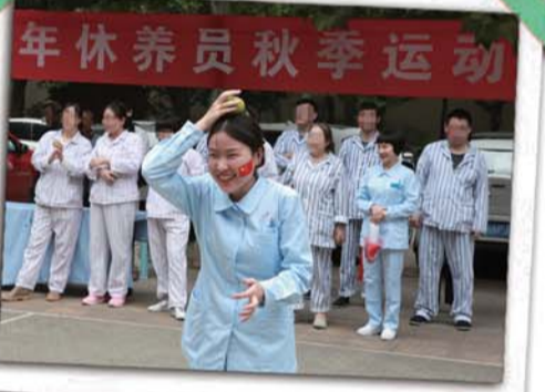
运动会现场气氛热闹非凡。