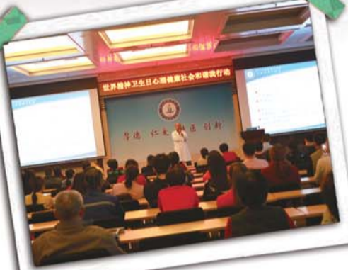
心理健康大讲堂,解疑答惑送健康。

精神障碍患者是社会的弱势群体,由于精神疾病的特殊性,更需要社会各界对他们的关怀和帮助,无论是在工作中还是在生活上,普及精神医学知识,提高人们的医疗主观能动性已成为医院所有工作人员的习惯,他们尽己所能使更多的人理解和接纳精神障碍患者,消除歧视。用耐心与坚守敲开患者“心灵壁垒”,让众多精神障碍患者更好更快的融入正常生活。