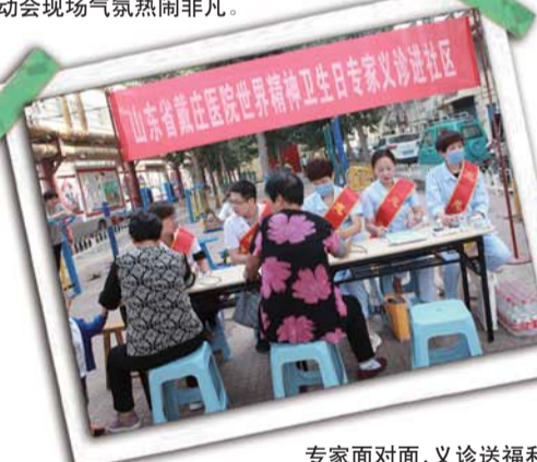
专家面对面,义诊送福利。