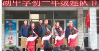
举行少先队建队仪式 近日,沂源县河湖中学组织初一新生少先队建队仪式。分别进行了唱国歌、唱队歌、宣誓等内容,每个新生的脸上充满了激情和斗志。(张荣)