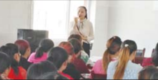
举办家庭教育讲座 近日,沂源县张家坡镇流泉小学邀请县家庭教育宣讲团成员对全校学生家长进行家庭教育知识宣讲,在家校之间架起了沟通的桥梁。(任晓寒)