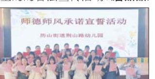
师德师风宣誓活动 为加强师德师风建设,进一步提升教师师德师风水平,近日,沂源县荆山路幼儿园组织全园教师举行师德师风宣誓活动。(夏巧凤 刘霞 王法慧)