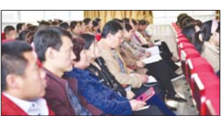
让家校联系栏“说话” 为加强家校合作,更好地发挥家校联系纽带作用,日前,沂源县南麻街道中心小学开展了让家校联系栏更好的“说话”活动。(徐纪梅)