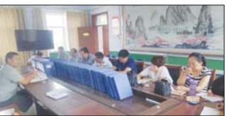
开展主题党日活动 为落实党员活动日制度,丰富活动形式和载体,近日,沂源县鲁村镇中心小学组织全体党员开展了“四个自信”专题教育活动。(刘艳翠 董纪圣)