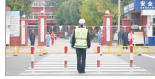
重视学生出入校安全 为切实保障学生的出入校安全,沂源县荆山路小学与县交警大队联合开展学校安全助学岗。在上下学的时间县交警大队及时到岗疏导交通。(杜青青 孙静)