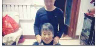
我为家长做点事 为增强同学们的劳动意识,锻炼同学们做家务的能力,近日,沂源县南麻街道东高庄小学组织全校学生参加“我为家长做点事”活动。(代元霞)