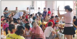
新生亲子活动 为了帮助新生宝宝们尽快熟悉新环境,适应和喜欢幼儿园生活,日前,沂源县振兴幼儿园精心组织了小班入园亲子活动。(王玲)

近日,傅家实验小学举行了2019年“秋之实”师生书法展活动。此次活动分硬笔书法和软笔书法两个类别,共收到全校师生硬笔作品200余幅,毛笔作品90余幅。内容以赞美祝福祖国和感受秋天之美为主,同时鼓励投稿者自创诗词文赋。作品中能看出师生平时坚持练习写字的“功底”扎实,彰显出该校的书法特色。 (徐晓华)