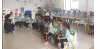
普法宣传活动 为营造和谐稳定的社会环境,鲁村镇教体办联合鲁村司法所积极开展一系列形式多样、精彩纷呈的普法宣传活动。(唐甜甜)