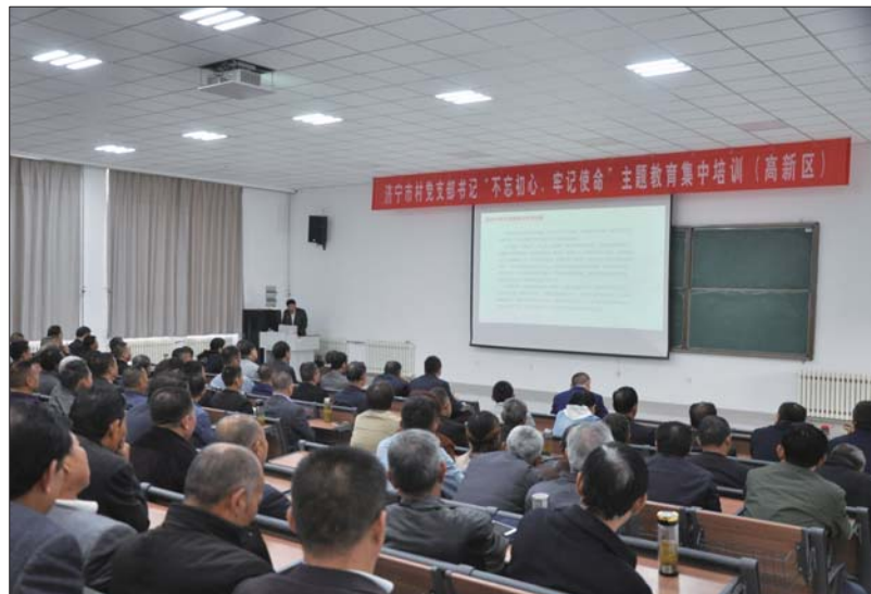
村党支部书记进行集中培训。

据了解，此次培训旨在充分发挥先进典型的示范引领作用，促进“强村带弱村，后进变先进”，抓实软弱涣散村党组织整顿。各村党支部书记将以此次培训为契机，着力深化理论武装、坚定政治信念、落实工作职责，不断提升工作质量，努力推动各项工作再上新台阶。