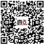
扫二维码下载参加活动

时间流逝,影像长存。本次启动的“晒出你和父母的合影”活动同样是让感人瞬间留存下来。合影再普通不过,但和父母的却寥寥无几。多年过去,打开相册,你发现一张和他们的合影也没有,大概会是一件令人遗憾的事情吧,所以快拿起手机和父母拍一张吧!