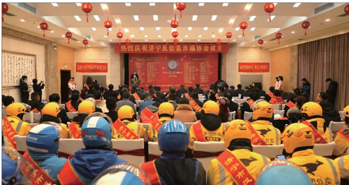
济宁市反信息诈骗协会揭牌成立。

本报济宁12月2日讯(记者 褚思雨 孙逢辉 通讯员 张正) 2日,济宁市反信息诈骗协会揭牌仪式举行。未来,协会将开展打击网络犯罪、信息诈骗公益救助等活动,从源头上遏制全市电信网络诈骗案件的发生。现场工作人员向反诈志愿者讲解和宣传反诈知识,进一步增强市民识骗防骗的能力。