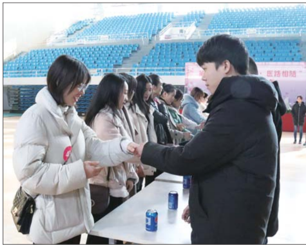
互动小游戏,单身男女很快相互熟悉起来。

在激烈的“爱情齿轮”男女协同赛跑比赛中,男士展现了绅士风度,女士展现了包容与细致。通过游戏,单身男女快速了解熟悉。现场还邀请部分男女嘉宾上台表演才艺,大家纷纷展示自己的特长与风采,加油声、喝彩声此起彼伏,现场