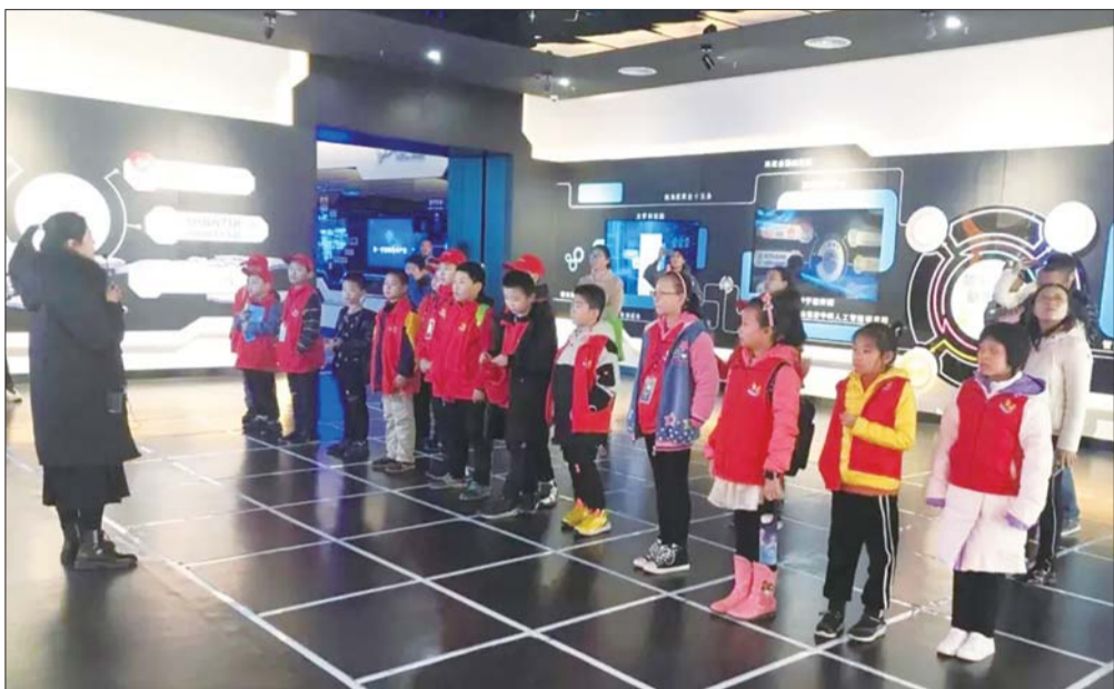
展馆吸引不少团体参观。

据了解,济宁数字经济展示中心位于济宁高新区科技新城的核心区,与科技馆、图书馆、档案馆相邻,每周三至周日向市民游客开放。需要注意的是,10至45人成团,统一在科技馆大厅集合。参观时间为9:30至11:30和14:00至16:00,场馆采取预约报名方式参观,可拨打电话0537-3255866、0537-3255888进行预约。