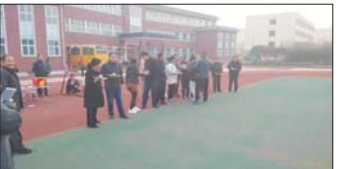
托球往返跑活动 近日,沂源县东高庄小学开展托球往返跑活动。体现了老师们乐观、积极、向上的精神风貌,及教师们“我运动,我健康,我快乐”的健康风貌。(宋忠保)