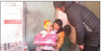
爱心活动 近日,为帮助贫困儿童温暖过冬,沂源县悦庄镇龙山幼儿园开展了“贫困龙山娃春天常在”活动。(耿文英)