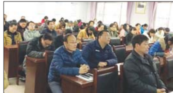
管理规范月活动 为进一步提高教师的工作热情,规范工作秩序,近日,沂源县河湖中学组织全体教师,召开期末学习规范月动员会。(李传禄)