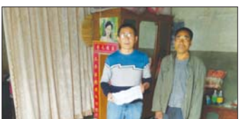
开展家访工作 近期,沂源四中教师重拾走家串户这一传统家访模式,利用休息日对困难学生开展家访工作。(翟乃文 刘士春)