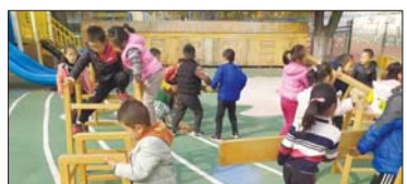
户外游戏活动 沂源县新城路幼儿园长期坚持开展户外自主游戏活动,幼儿在自主游戏中自主选择游戏材料,自主选择游戏内容、自主选择游戏伙伴,自主制定游戏规则等。(杜春燕 杜丽娟)