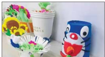
班级文化 为营造优雅和谐、生动活泼的班级文化氛围,展示富有个性化的班级文化,近日,沂源县振兴路小学开展班级文化创建活动。(王梦洁 黄晓艳)