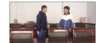
元旦节目演练 为进一步丰富学生的课余生活,为学生的全面发展提供舞台,迎接2020年的到来,近日,沂源县河湖中学各班举行元旦节目的筛选和演练。(齐林)