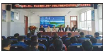
党课报告会活动 近日,沂源县大张庄镇中心小学承办镇教体办“不忘初心,牢记使命”沂源红师德宣讲团大张庄专场暨党总支书记党课报告会活动。(伊希友)