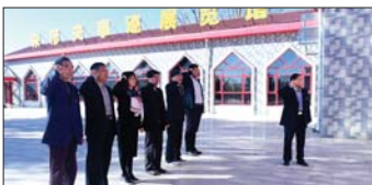
参观红色教育基地 为深入开展“不忘初心,牢记使命”学习教育活动,日前,沂源县张家坡镇流泉完全小学党支部组织全体党员赴朱彦夫纪念馆参观学习。(任晓寒 宋尚建)