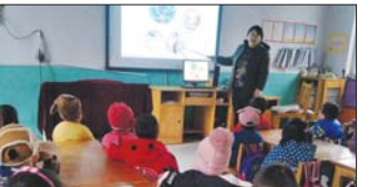
预防手足口病教育 近日,沂源县悦庄镇王家泉幼儿园举行冬季预防手足口病教育活动,老师向孩子们传授了一些手足口病的知识,避免手足口病的发生。(宋尚美 苏丽雨)