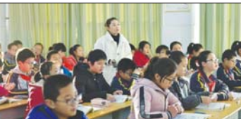
打造高效课堂 近日,沂源四中启动“六环节数字教学法”打造高校课堂教学论坛活动。并通过集体备课、观摩课、研讨交流、公开课、评课总结等形式开展。(刘士春 翟乃文)