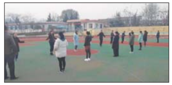
教师跳绳活动 为提高老师们参加体育锻炼的积极性,近日,沂源县东高庄小学举行了教师跳绳比赛活动。整个活动始终充满了紧张而和谐的气氛。(谭纪红)