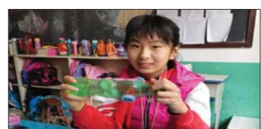
垃圾分类教育 为增强队员的环保意识,鼓励队员从小事做起,从身边做起,争当保护生态的小卫士。日前,沂源县南麻街道中心小学开展“垃圾分类减量”主题教育活动。(孟淑敏)