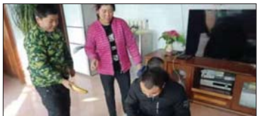
开展家访活动 为整合学校、家庭的教育力量,更全面地了解学生在家的表现情况,近日,沂源县燕崖中学开展了“走进学生家庭,走进学生心灵”家访活动。(陈作涛 孟庆坤 杨希艳)