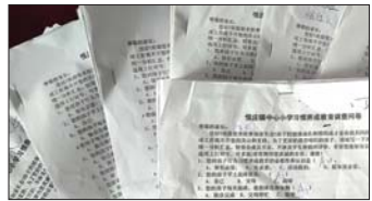
行为习惯培养 近日,沂源县悦庄镇中心小学通过问卷调查,明确学生不良习惯成因,并制定相应培养策略扎实做好学生良好行为习惯培养工作。(梁海亮)