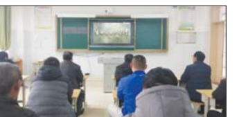
学习人民教育家 近日,沂源县东里镇福源小学组织开展了“向人民教育家于漪同志学习·新时代如何争做‘四有’好老师”交流研讨活动。(徐美刚)