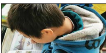
开展读书活动 为了让师生积极行动起来,自觉养成多读书、读好书的良好习惯,近日,沂源县悦庄镇东赵庄完小开展“我读书我快乐”活动。(董宁宁)