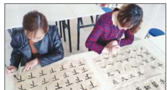
教学相长 为提升学校青年教师的教学能力和业务水平,激发老教师更新教育理念,近日,沂源县东里镇水北小学举办了青蓝教师教学大赛。(齐凤)