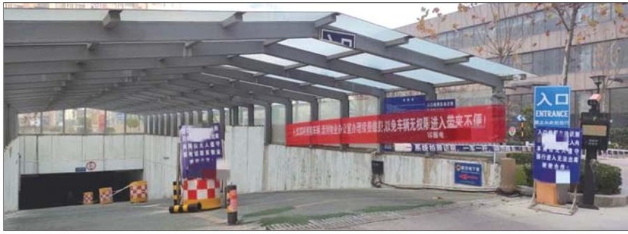
在泰城一些小区,车位只卖不租几乎成了普遍现象。