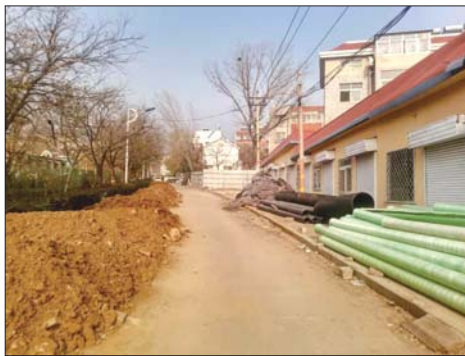
建筑用品和渣土让原本就不宽的路变得更窄了。

随后,记者来到擂鼓石大街中段建设工程指挥部,一位工作人员表示相关情况并不了解,让记者与施工单位联系。经查询,擂鼓石大街虎山路中段建设(普