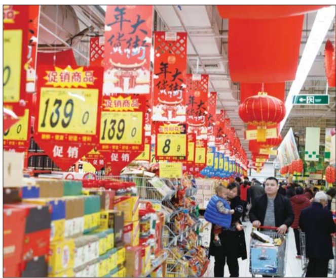
白酒专柜很是热闹。

和去年持平,中低端白酒卖得比较好。”该商超客服经理肖燕称,今年济宁市民多钟情于地方品牌白酒,红太阳系列酒水一天就能出100多箱。“腊月23日到29日是酒水销售最旺的时间段,预期日均销售量还会有上升。”肖燕介绍,从去年开始,高档白酒的销量就开始下滑,虽然白酒的销量没落下,但销售额