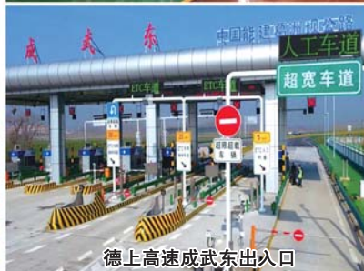
德上高速成武东出入口