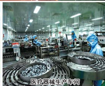
医疗器械生产车间