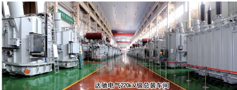
达驰电气220kV级总装车间