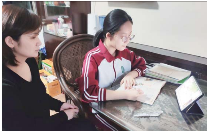
亲子陪伴，共同学习。