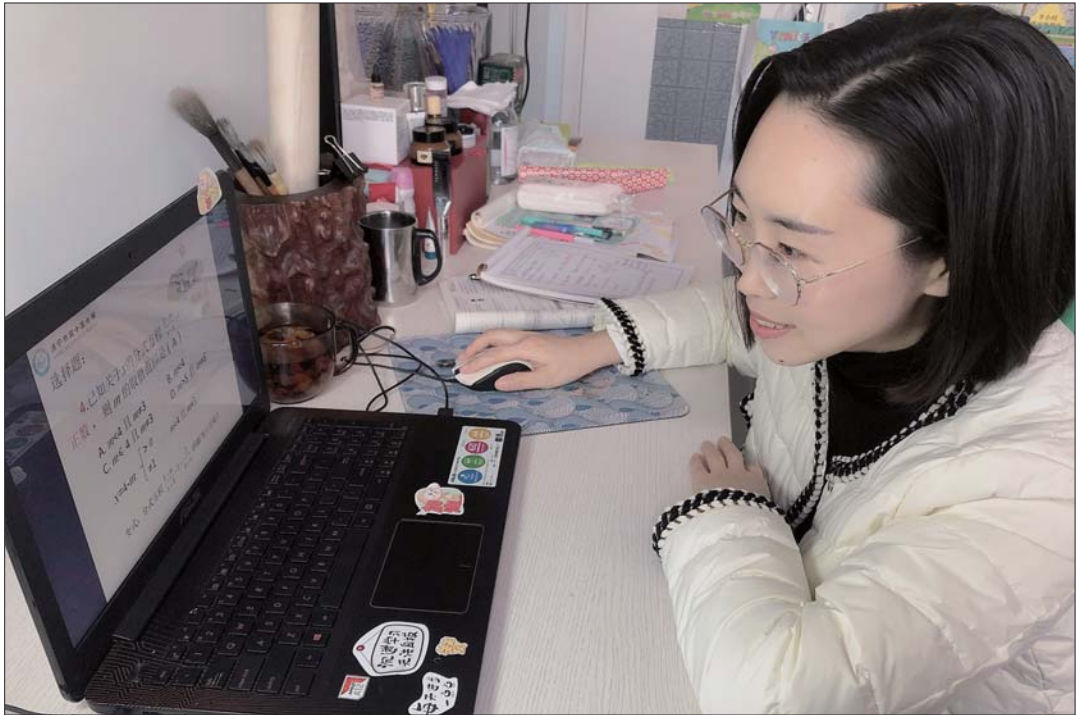
一位老师在线上辅导。

学校倡导，学生们保证每天一小时的运动时间。班主任采用师生同活动、及时评价等形式来鼓励学生加强锻炼，同