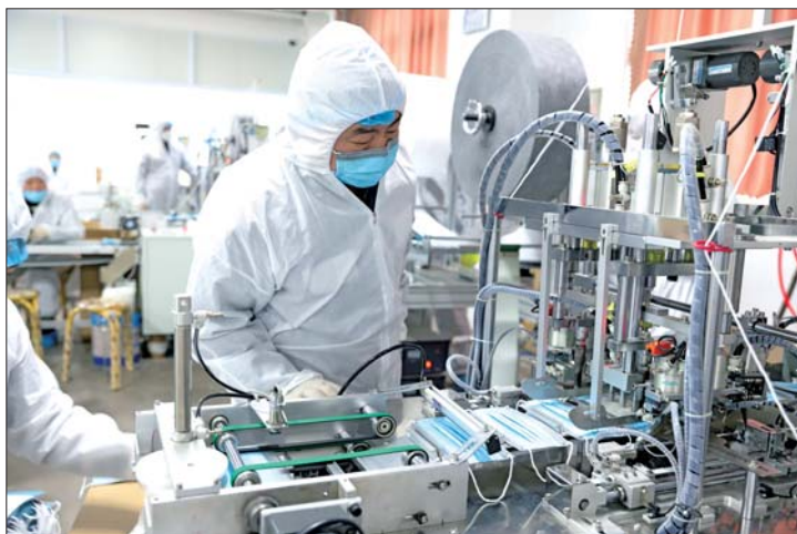
圣泉集团车间内,工人正加班加点生产口罩。

1月28日下午,山东省新闻办召开的新闻发布会上介绍,山东各级对运输农副产品、生活物资和医用原料和成品等的车辆开辟绿色通道,发放专用通行证。山