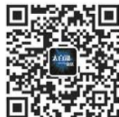
济宁太白湖新区官方微信