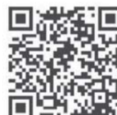
济宁太白湖新区政务网