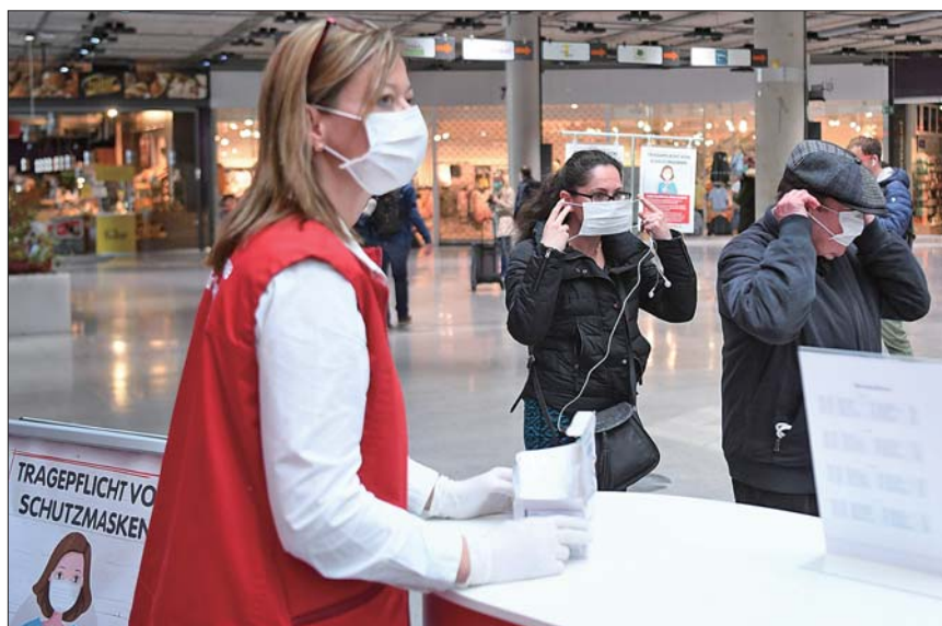
4月1日，在奥地利萨尔茨堡，超市员工向顾客发放口罩。