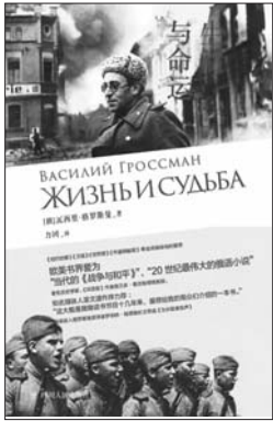
四川人民出版社 力冈译 〔俄〕瓦西里·格罗斯曼 《生活与命运》

把这两部作品放在一起,确实有太多可比的地方。首先,题目本身都是很史诗化的;其次,都是以现实主义手法写一场战争。《战争与和平》写的是1812年反拿破仑的战争。《生活与命运》写的是1942年苏联人反对希特勒的战争。在苏联历史上,只有两次战争前面是加上两个限定词的,一个是“伟大的”,一个是“卫国的”。这两次战争都被称作“伟大的卫国战争”。两部作品分别以这两次战争为对象,结构和写法很相近,都是现实主义的手法,都是很全景的,从前线写到后方,从家庭写到个人,来回交织的。人物也很多,《战争与和平》有八百多个人,《生活与命运》也有五百多个人物。这个作品主要是写的一个家族,《战争与和平》写的是四大家族。以前有人比较过《战争与和平》和《红楼梦》,为什么是四大家族,为什么不是三个,或者两个。我们