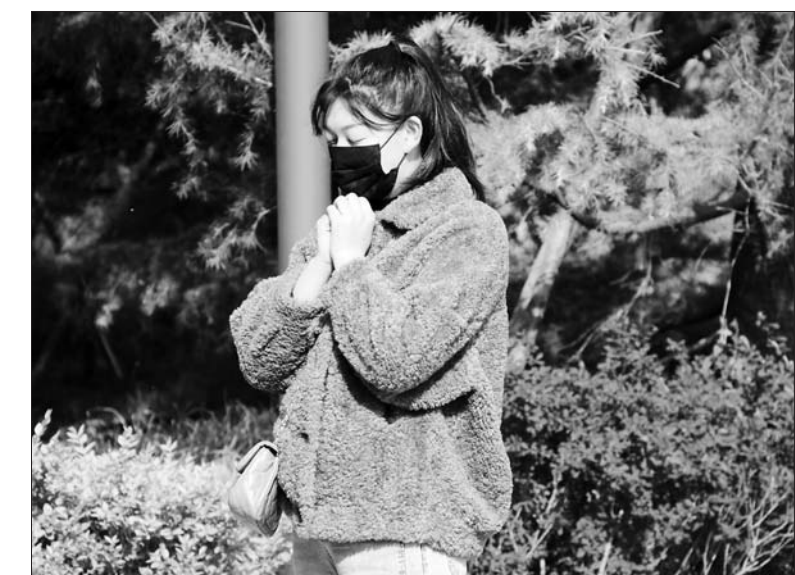
警报响起,济南一名市民停下脚步,双手握在一起,缅怀逝者。