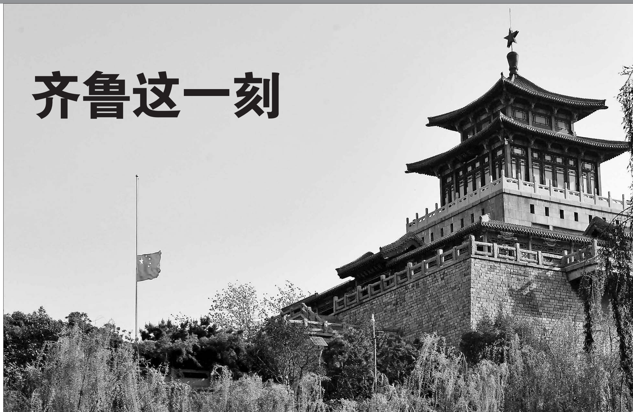
4日上午,济南解放阁降半旗悼念抗击新冠肺炎疫情战斗牺牲烈士和逝世同胞。

齐鲁大地,凝噎肃立。4月4日,清明节,我省各地各行各业的人们都在用自己的方式深切悼念抗击新冠肺炎疫情斗争牺牲烈士和逝世同胞。