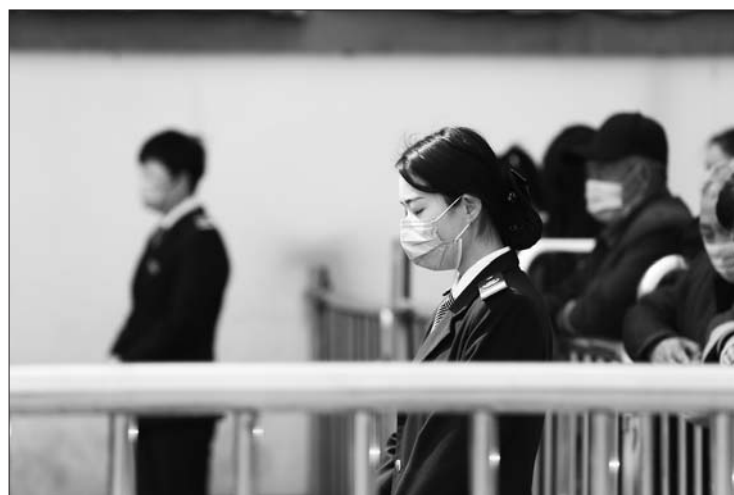
济宁汽车站哀悼逝者。