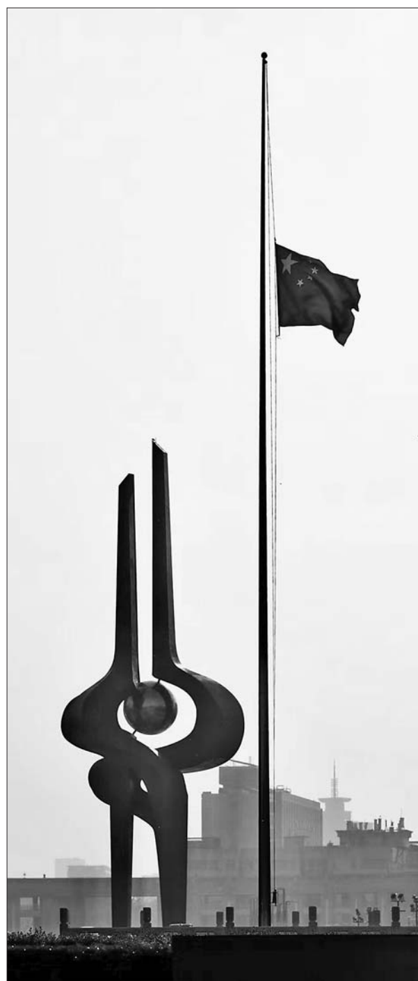
肃穆的济南泉城广场。