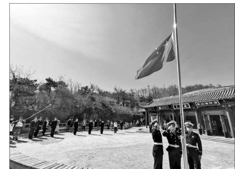
泰山之巅,驻守的消防员、民警及景区工作人员降半旗悼念逝者。