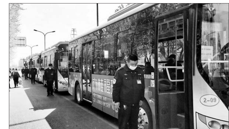
潍坊公交车驾驶员哀悼逝者。