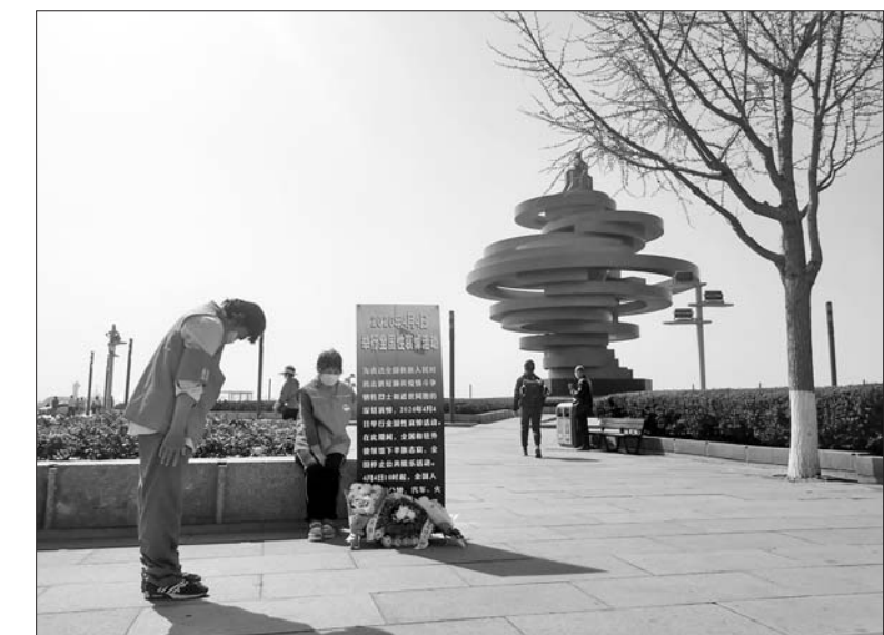
青岛五四广场,志愿者送来鲜花,鞠躬向逝者寄托哀思。