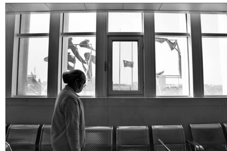
德州人民医院一名护士在窗前默哀。