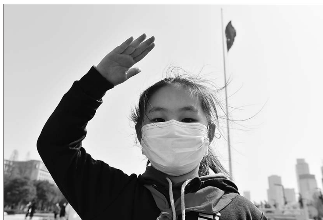
济南一小朋友向烈士敬礼,眼神坚毅。