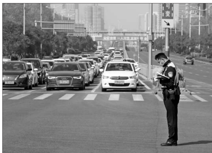
交警脱帽,车辆鸣笛哀悼。