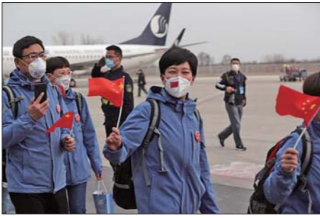
山东省援助湖北第五批返鲁人员(山东省第六批、第七批援助湖北医疗队)共计399人,分别乘坐包机返回济南和青岛