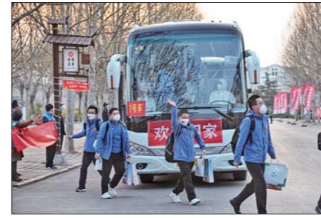
山东省援助湖北第四批返鲁人员(即山东省第三批、第十二批援助湖北医疗队)314人,圆满完成各项任务,从武汉飞抵济南