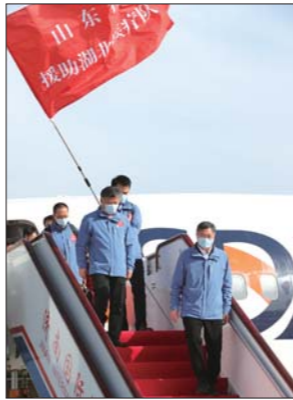
山东省援助湖北第三批返鲁人员凯旋