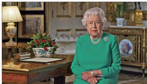
这是英国女王伊丽莎白二世5日发表全国电视讲话的视频截图。