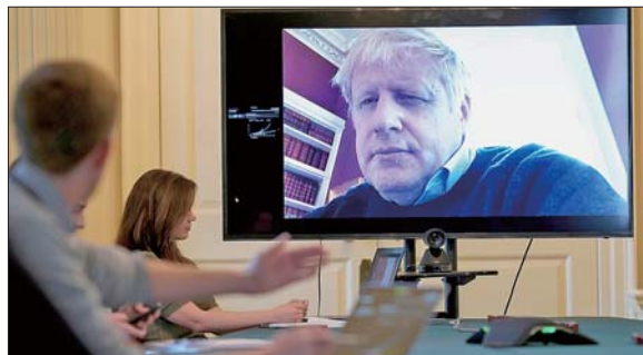
因感染新冠病毒而自我隔离的英国首相约翰逊,3月27日通过视频形式主持政府每日疫情会议。

法国《世界报》刊登学者斯莫拉尔的文章指出,新冠病毒疫情为本就矛盾重重的跨大西洋关系开辟了一个“新战场”,令“民族自私主义”暴露无遗,而多边主义则完全被抛到一边。综合新华社消息