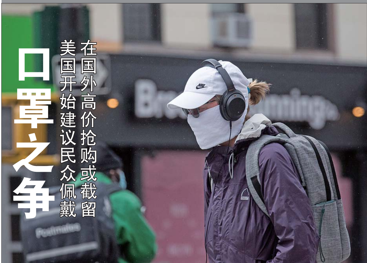
4月3日,一位戴面罩的行人走在美国纽约布鲁克林街头。

美国总统特朗普日前在白宫记者会上表示,美国疾病控制和预防中心建议民众佩戴“布质口罩”,以预防新冠病毒感染。这是美国官方在佩戴口罩问题上态度出现的新变化。此外,美国近期多次高价抢购或截留德国、法国、加拿大等盟友订购的口罩等防疫物资,引发相关国家强烈不满。分析人士指出,在疫情蔓延背景下,美国争夺防疫物资的单边主义做法正招致越来越多反感,令美国与盟友之间的离心力进一步增大。