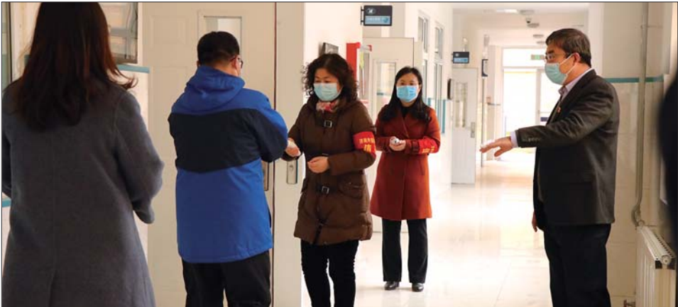
开学前,济南外国语学校教职工模拟学生进行防疫演练,测温进入教室。

“2020年山东高考时间为7月7日至8日,普通高中学业水平等级考试则延期到7月9日至10日。”4月7日上午,在山东省政府新闻办召开的新闻发布会上,省教育厅、省工信厅等四部门相关负责人,通报春季学期学校开学相关准备工作,并回答记者提问。 “按照教育部部署,2020年全国高考延期一个月举行,考试时间为7月7日至8日。”省教育厅总督查邢顺峰介绍,山东具体科目考试时间安排为:7月7日上午语文,下午数学,8日下午为外语笔试。 需要注意的是,普通高中学业水平等级考试(等级考)由我省自主命题,考生从思想政治、历史、地理、物理、化学、生物等6个科目中自主选择3科参加考试。 邢顺峰指出,等级考也相应延期一个月举行,“时间为7月9日至10日,7月9日上午物理、思想政治,下午化学,7月10日上午历史、生物,下午地理。” “考试科目顺序是全国高考综合改革第二批试点省市共同研究确定的,主要考虑是在上午同时选考两科的考生人数最少。”对于中考,邢顺峰表示,以往各市中考基本上是安排在高考之后进行,考虑到今年高考延期一个月举行,按照教育部的指导意见,省教育厅将指导各市推迟中考时间,根据各自实际确定具体时间,原则上安排在高考之后进行。