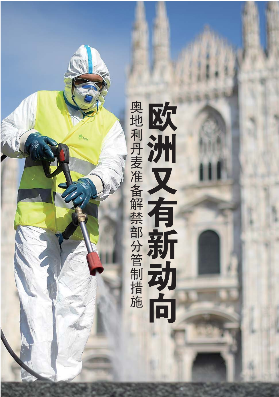
意大利米兰的工作人员近日清洗米兰大教堂广场地面。