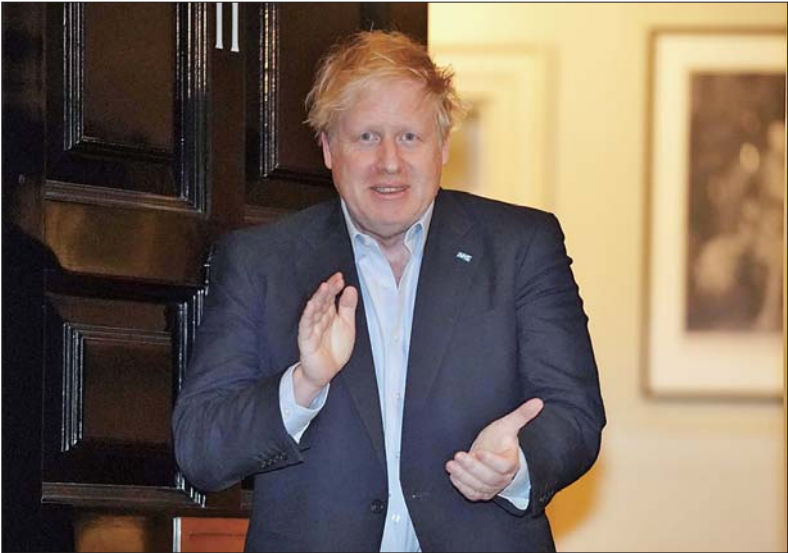
4月2日晚,英国首相约翰逊在伦敦唐宁街11号门口为NHS医护人员鼓掌。这是他入院前最后一次公开露面。