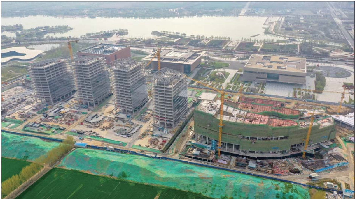
济宁市文化产业园项目航拍图。

济宁市文化产业园(市文化中心三期)自复工以来,在做好疫情防控的同时,全力推进项目复产复工。截至当前已到岗人员966人,复工率达到100%。;文化创意博览城地上主体结构已完成工程量的90%,文化创意基地外幕墙已完成50%,孵化基地地下工程已完成30%,预计12月底可完成项目整体外幕墙和室外景观工程施工。