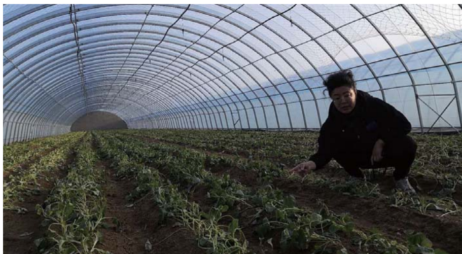
徐家塔村地瓜育苗大棚。