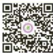
人文艺术与教育学院