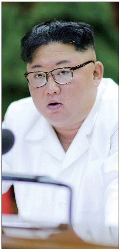
朝鲜最高领导人金正恩