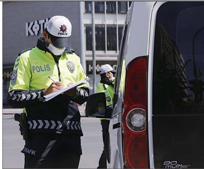
18日,在土耳其首都安卡拉,警察检查道路上的车辆。

在去年底召开的朝鲜劳动党七届五中全会上,金正恩批评美国在朝美对话中拖沓,警告如果美国继续坚持对朝敌对政策,朝鲜半岛永远不会实现无核