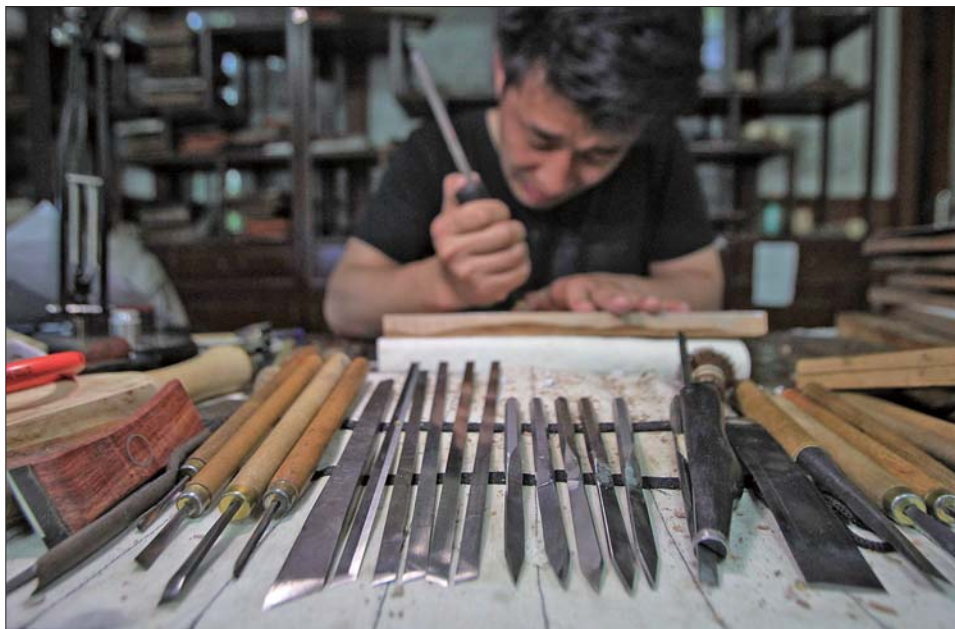
拳刀多是自己打造的,这样用起来才顺手。