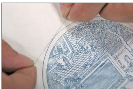
在李振豪的作品中,不少线条与头发丝差不多粗细。