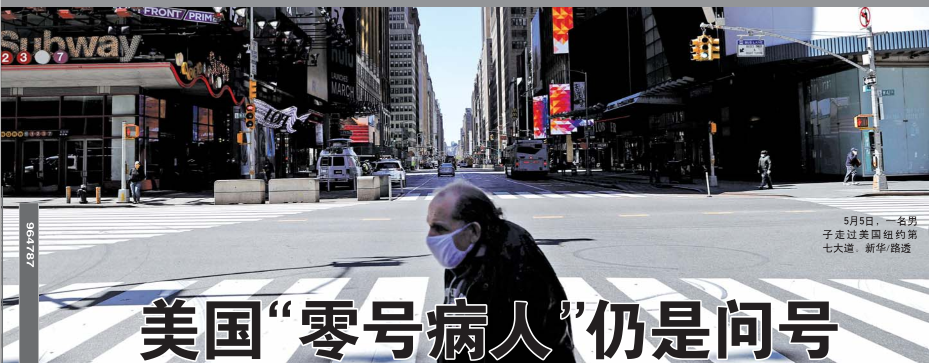
5月5日，一名男子走过美国纽约第七大道。