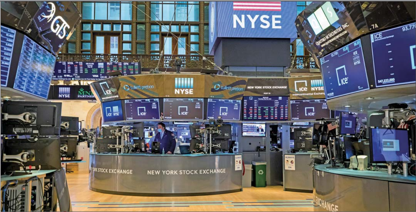
当地时间5月26日，美国纽交所交易大厅部分恢复开放。

当地时间5月26日，美国纽约证券交易所迎来重启时刻。纽交所总裁坎宁安当天宣布，在因新冠疫情关闭两个月后，纽交所交易大厅于当日部分恢复开放。不过，受疫情影响，重新开放后的交易大厅将执行新的工作规定，重启初期仅允许约80名经纪商重返岗位，昔日人头攒动的热闹场景暂时无法重现。