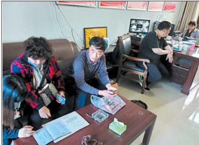
街道工作人员认真执行相关工作。

为进一步规范市场主体经营行为,维护良好的市场经济秩序,济阳街道多措并举,实行“四步走”工作法,开展查处无证无照经营专项行动,营造良好营商环境。