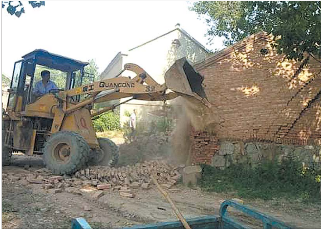
吕家村拆除残垣断壁。

自曲堤镇人居环境整治提升专项行动开展以来,吕家村充分发挥党员干部示范引领作用,坚决落实“硬核”举措,引导广大群众参与,群策群力,持续刷新全村“颜值”。