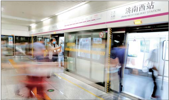
济南地铁3号线济南西站,乘客正有序上车,光影交错。