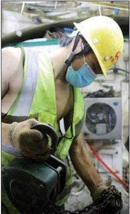
▲施工人员在盾构机旁挥洒汗水。