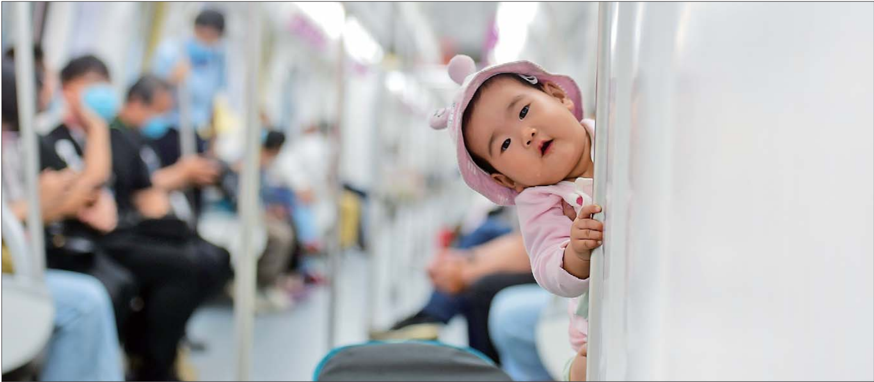
济南地铁1号线车厢内,一个小宝宝好奇地向外张望。