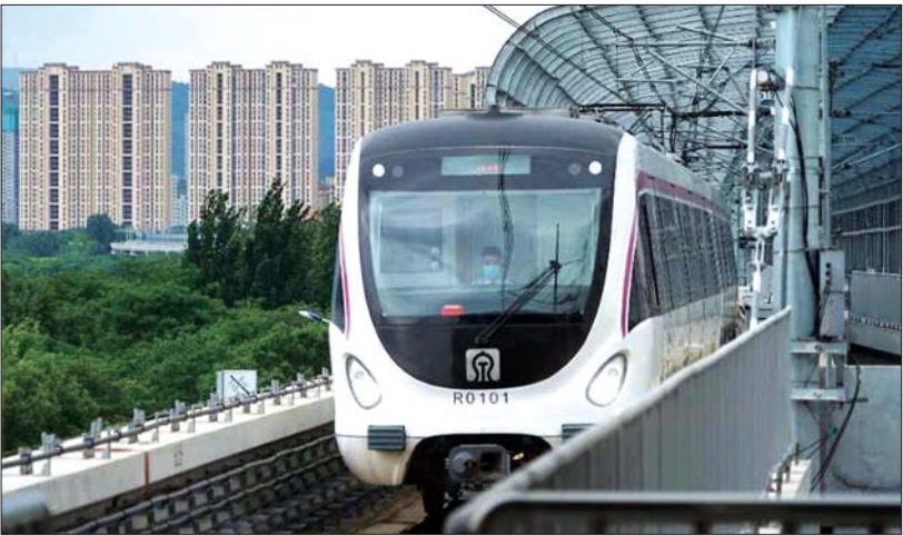
济南地铁1号线高架段。