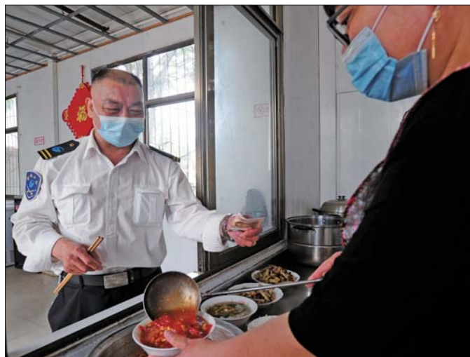
中午休息时间短，韩师傅就在食堂简单吃点。