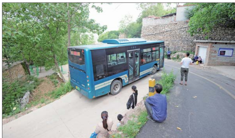
▼ 早晨6点55分，881路公交车开进长岭村。