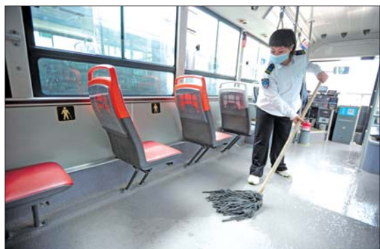
◀ 城际公交灰尘较多，小韩师傅就一天三次清理卫生。