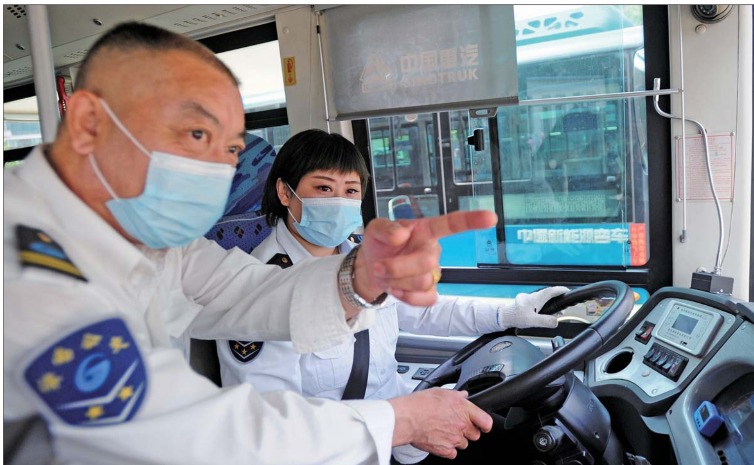
父女两人有机会就交流在支线上安全驾驶的经验。