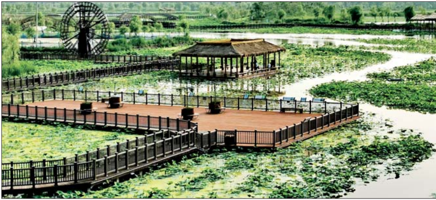
十里荷塘美景如画,成为市民打卡必选之地。