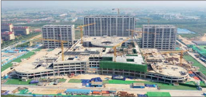
滨州“三院”项目是滨州市重点民生工程,图为建设中的滨州市人民医院西院区。