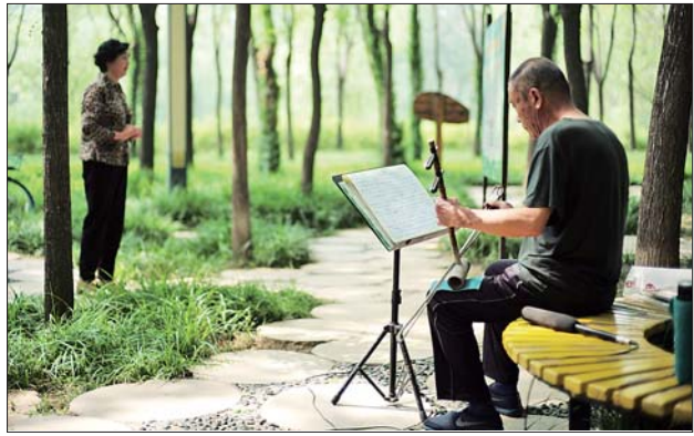
打造“公园之城”,滨州新立河公园成市民休闲好去处。