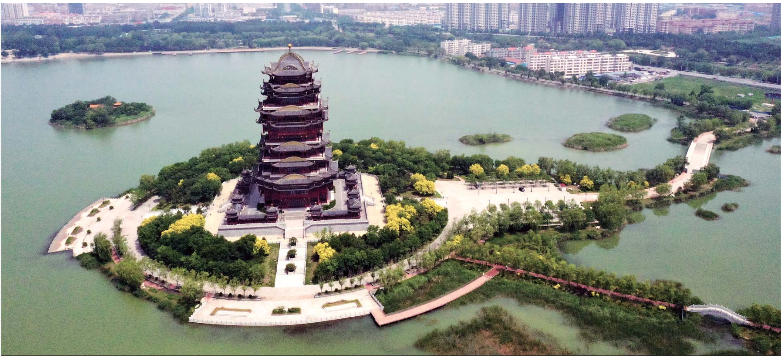
位于滨州蒲湖内的黄河楼,在此可南观黄河,北瞰城区。