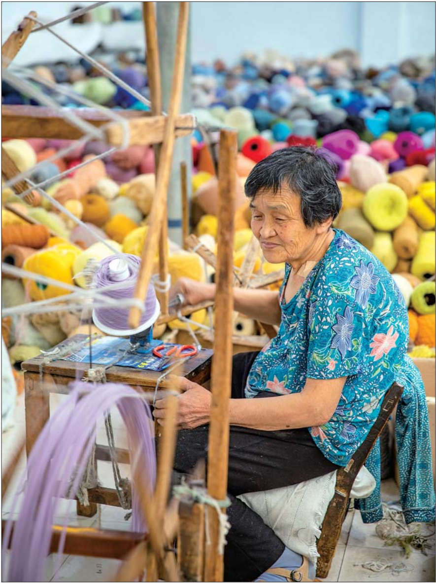
惠民绳网产业是惠民县乃至滨州市的传统产业,传统的绳网生产出了特色产品,不仅仅用于体育领域,还可以居家使用。

滨州是黄河下游一座依水而建,缘水而兴,因水而美的城市。黄河在滨州过境而过,横跨东西,塑造了不可多得的黄河文化。采访团先后来到打渔张森林公园、十里荷塘风景区、黄河之星生态园等黄河沿岸风情带,走近黄河,近距离感受滨州黄河的魅力。采访团实地探访了盟威戴卡轮毂生产车间,亿利源清真肉类食品生产加工线,愉悦家纺及大健康产业,惠民绳网产业,阳信瑞鑫地毯,滨州市人民医院西院区,滨州市妇幼保健院新院(市儿童医院)、滨州市中医医院新院“三院”建设项目以及渤海先进技术研究院、魏桥国科(滨州)科技园等项目,感受城市温度,体验发展热度,用相机和无人机记录下滨州正在发生的美好。 齐鲁晚报·齐鲁壹点记者