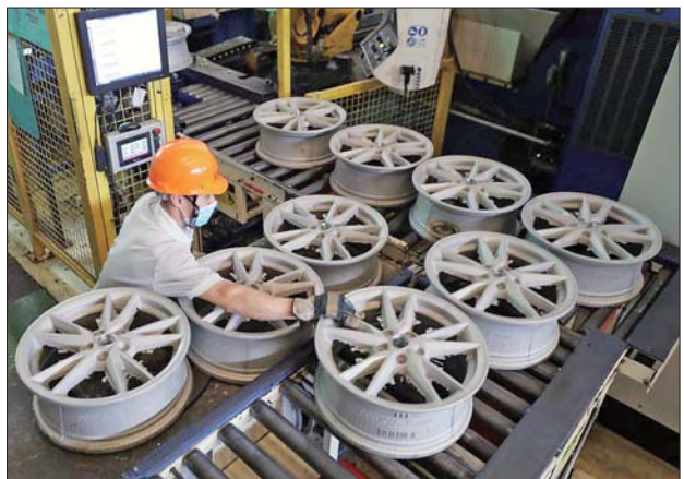
滨州盟威戴卡轮毂公司目前已成为亚太地区实力雄厚的高端轿车轮毂生产企业。