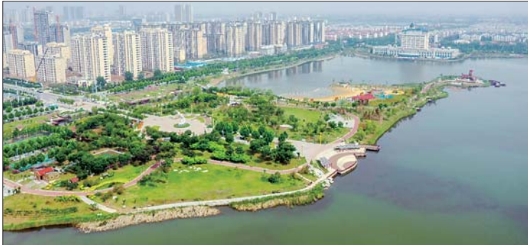
白鹤湖湿地公园波光粼粼,是市民夏日乘凉好去处。