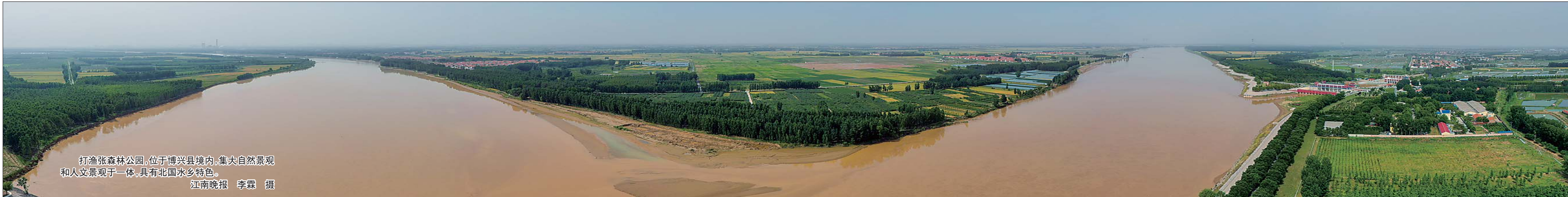
打渔张森林公园,位于博兴县境内,集大自然景观和人文景观于一体,具有北国水乡特色。