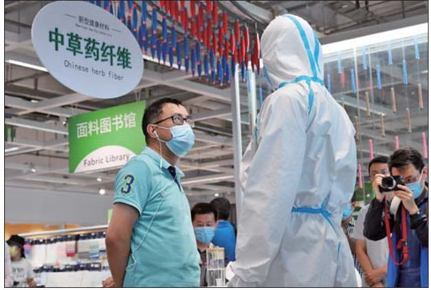
愉悦家纺居家世博馆展现企业近年来的发展成果。