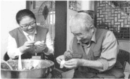
资料图片:福彩义工和老人们一起包饺子

让更多的老人受益于福彩公益金的资助,感受到福彩志愿者的关爱,安享美好晚年。 在助力脱贫攻坚活动中,烟台福彩先后组织党员到栖霞凤凰庄村、莱阳西石河头村、蓬莱市三里沟村等地开展帮扶贫困村工作,选派第一书记包村帮扶,为村民建设培训基地帮助他们早日脱贫致富,走进社区慰问困难群众,在春节期间组织书法家志愿者为村民送去“福”字对联,满足老百姓的文化需求。 在关爱残疾群体方面,烟台福彩开展的“福彩大爱·有爱无碍”公益活动中累计投入近35万元福彩公益金,支持自闭症群体康复工作。此外,志愿者们还走进烟台市残疾人康复教育中心,心生元、春常藤等康复机构开展志愿服务,在自闭症日为市民分发蓝丝带,联合美术机构举办“星星画语”书画展等活动,呼吁全社会关注自闭症群体。