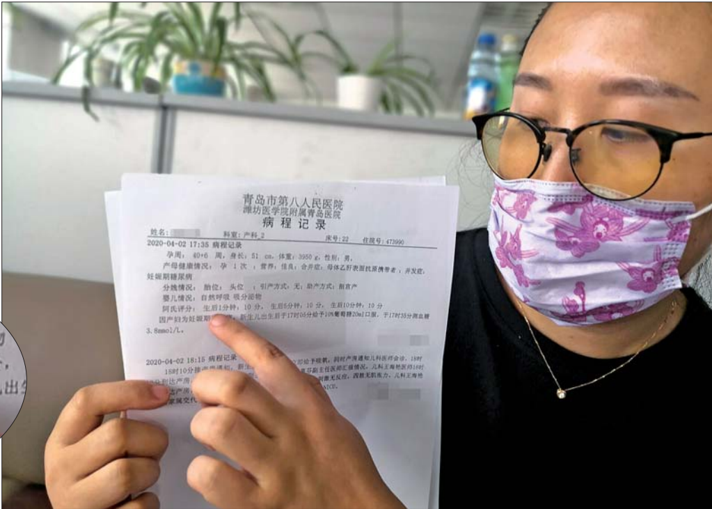
孩子母亲提供的病程记录显示，男婴阿氏评分为10分。