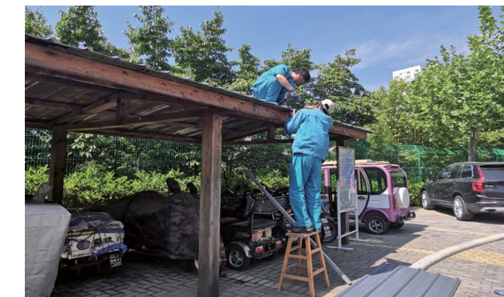
维修工人在给车棚更换彩钢瓦。