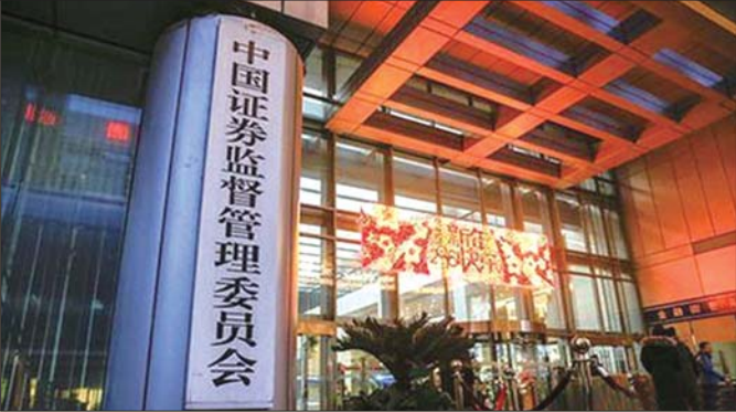
中国证监会(资料图)