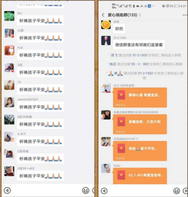
邻居们在微信群里祈祷孩子平安,还建立爱心捐助群并捐款。