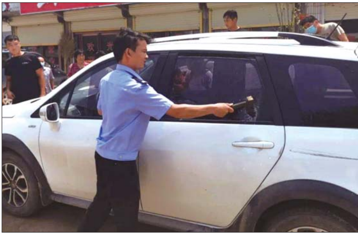
民警强行砸窗救出孩子。

万一不小心将孩子单独落在了车内,大人要保持镇定,通过与孩子沟通使其保持情绪稳定,引导孩子自行从车内开门,同时拨打公安、消防等电话寻求专业援助。若短时间内无法打开车门,不要犹豫,果断砸窗,切不可因舍不得而耽误救援。孩子被救出后,要及时对孩子做一些散热、补水等措施。如果孩子有昏迷情况,要立即送医。