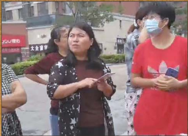
热心邻居为母女俩的不幸感到惋惜和同情。