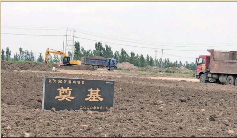
在安丘市景芝镇王庄村,正大潍坊现代食品(360万蛋鸡)全产业链项目于6月3日奠基动工。