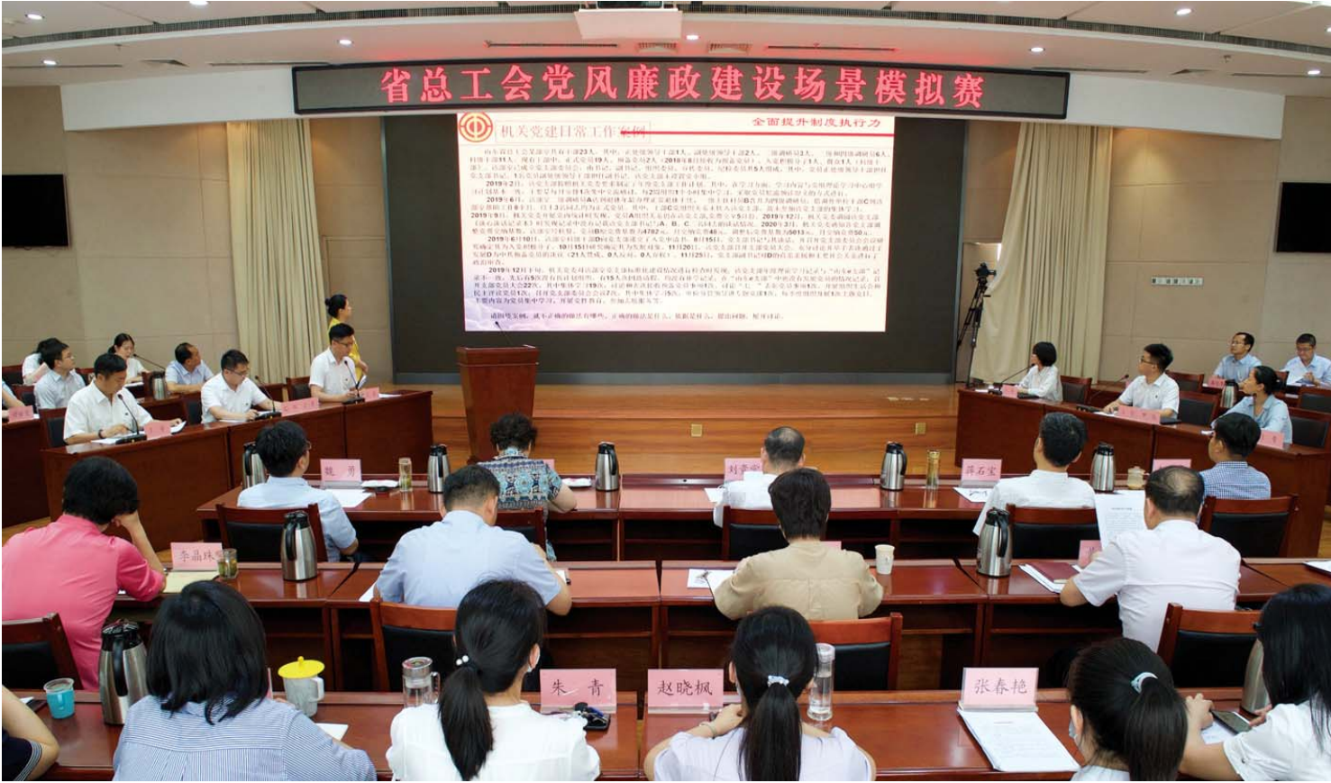
近日，山东省总工会组织党风廉政建设场景模拟赛。

习近平总书记强调，“机关党建工作必须适应新形势新任务的需要，走在党的基层组织建设的排头。”近年来，省总工会坚持以习近平新时代中国特色社会主义思想为指导，全面落实习近平总书记关于机关党建重要论述，以党的政治建设为统领，以“走在前、作表率”为目标定位，按照省委部署要求和省直机关统一安排，紧紧扭住机关党建的责任、使命、方法、制度、队伍“五个关键”，切实做到“六个更加突出”，以实际行动做到“两个维护”、践行“三个表率”、建设模范机关。