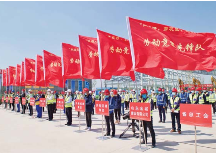
省总工会动员全省广大职工群众踊跃开展“六比六促”劳动竞赛。

6月12日，一场别开生面的党风廉政建设场景模拟赛在省总工会举行，各参赛队员围绕机关党建、正风肃纪、新闻宣传报道、文明行为规范、落实机关规章制度等案例展开激烈辩论和剖析。 据悉，这次场景模拟赛，以着力解决机关作风建设突出问题，凝心聚力建设模范机关为主题，是省总工会开展“党风廉政建设月”活动13个具体动作之一。省总工会连续三年开展“党风廉政建设月”，创新性开展党风廉政建设场景模拟赛，通过一系列活动进一步强化廉政意识，党员干部思想得到更深的洗礼。 据悉，山东省总工会更加突出政治引领。把是否坚决做到“两个维护”作为检验党建工作的首要标准，以党的政治建设为统领推进党的各项建设。深化理论武装。系统梳理、全面落实习近平总书记关于机关党建、关于工人阶级和工会工作、关于弘扬劳模精神劳动精神工匠精神、关于抓落实等4个方面的重点论述。制定8个方面37项任务79条贯彻落实党的十九届四中全会精神的具体措施。严格落实党组理论学习中心组集中学习研讨、基层党组织周一集中学习制度。及时跟进学习习近平总书记最新重要讲话精神和党中央新的决策部署，学习贯彻省委、全总重要会议、重要文件精神。联合山东大学开展工会重大理论和实践课题研究。 加强政治建设。举办“加强党的政治建设”专题辅导，制定落实请示报告制度具体措施。建立并落实6个项目25项学习贯彻习近平总书记对山东工作重要指示要求工作台账。严明政治纪律和政治规矩，严格执行新形势下党内政治生活若干准则，严格落实