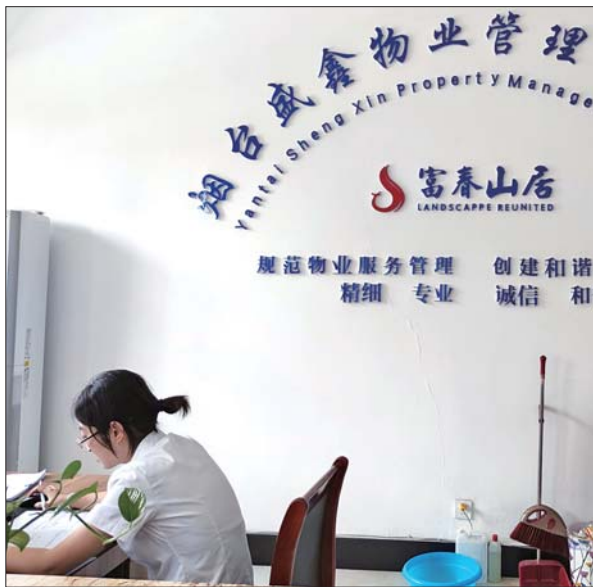
小区物业发出通告后,肇事者已登门道歉。

根据我国《刑法》规定,高空抛物、坠物造成他人人身伤害或者重大财产损失的,将可能构成过失致人重伤罪、过失致人死亡罪、故意杀人罪或者以危险方式危害公共安全罪等罪名,构成以上犯罪的,依法应当