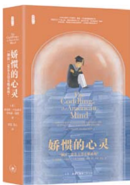
《娇惯的心灵:“钢铁”是怎么没有炼成的?》 [美]格雷格·卢金诺夫 乔纳森·海特 著 田雷 苏心 译 生活·读书·新知三联书店

人这一生,失败、受辱和痛苦的经验总是如影随形。《娇惯的心灵》一书指出,人类需要身体和心