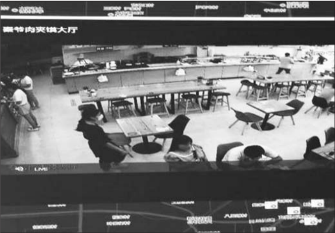
兖州区市场监督管理局智慧监管平台。

随着商事制度改革和“放管服”改革的深入推进,兖州区市场监管局积极拓展“互联网+市场监管”智慧监管平台支柱系统,上线了智慧监管平台、日常监督检查系统、在线监管三个子模块,通过信息数据搜集分析处理,解决事中事后监管难题,同时为事前服务提供坚强依据。 “一店一码”公示,犹如利剑高悬,督促企业依法诚信经营,提升行业规范水平。监管人员积极探索运用智慧监管码,完善对食品、药品等经营行业的日常安全监督,可以不受时间、环境约束,对经营商户进行远程跟踪,无缝监管,使智能化公示监管常态化。 除此之外,监管人员在使用过程中,发现问题及不足及时上报,统计部门推动数据统一融合,从而做到放大监管数据的价值,为执法监管提供过硬的决策支持。