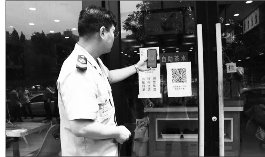
兖州区市监局推出智慧监管码,实现精准监管。

近日,在兖州区的很多商家店内都有一张二维码,拿出手机扫一扫,商户注册信息、许可范围、从业人员、监管信息等一览无遗,这是兖州区市场监督管理局作为试点率先推出的集查询、信用公示、消费维权等功能于一体的“一店一码”公示体系。