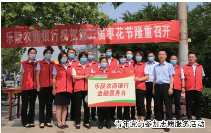
青年党员参加志愿服务活动