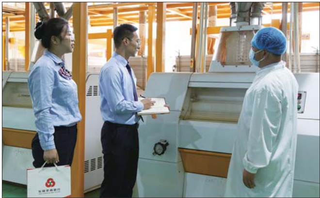
客户经理主动对接企业,了解融资需求