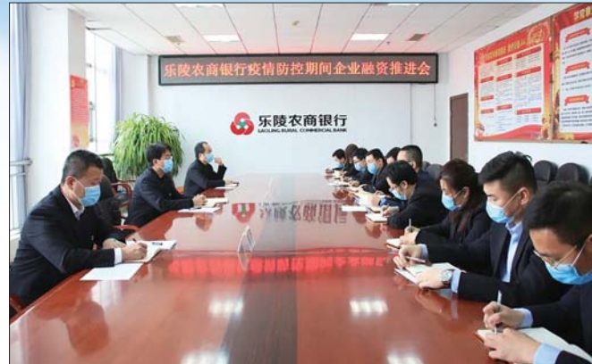
召开疫情期间企业融资推进会

专项政策,减费让利,解决“融资贵”问题。围绕“小微企业融资实际利率下降”关键环节,农商行制定疫情期间贷款专项政策,通过防疫应急贷、防疫复工贷等专属信贷产品,全面降低企业融资利率。如:“防疫复工贷”,保证类贷款利率低至5.66%,较同档次贷款利率最多下浮120个百分点,抵押类贷款利率低至5.22%,较同档次贷款利率下浮60个百分点。对符合农商行普惠金融政策的新增小微企业抵押类贷款业务,实行一次评估授信、五年循环使用,同时抵押登记费、押品评估费全部由农商行承担,确保小微企业“轻装上阵”。积极推进“首贷培植”行动,降低首贷客户贷款利率,提高首贷客户获贷率。同时,充分利用低息人行