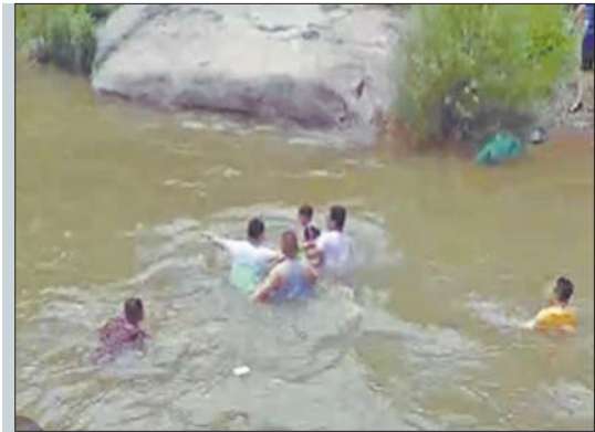
几名大汉跳进水里救孩子。