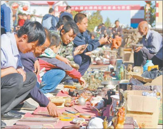
阳信县水落坡民俗文化小镇。

活动期间来不了?藏品看不到?别着急,齐鲁晚报·齐鲁壹点上线千件藏品展播平台,让您足不出户就能看到各具特色的传世之宝。目前,展位正在火热招商中,本届交流展所有展位全部免费,欢迎提前预订。预订电话:17861598033,15564070601。