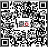
扫码下载齐鲁壹点 关注摄影频道