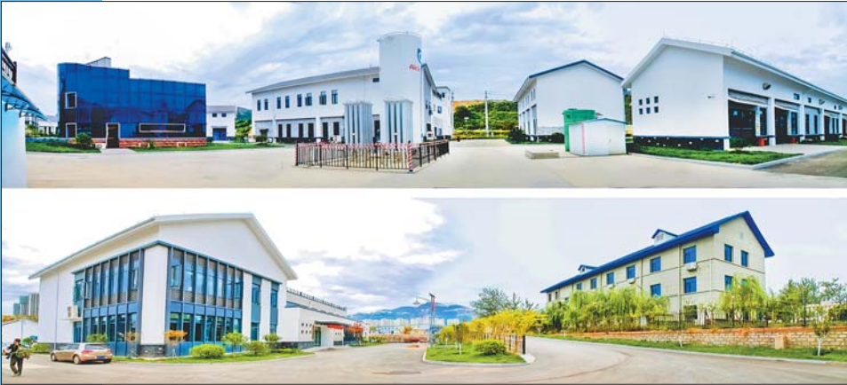
一等奖 现代化水厂——南康