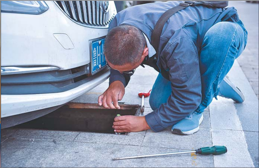
优秀奖 抄表工 杨德俊 摄

“自来水”是我们生活中最熟知的刚需品,但它背后的故事却鲜为人知。为挖掘、展现水务人如何保障供水、服务社会的点点滴滴,济南水务集团日前启动了第二届“记忆·泉城自来水”摄影大赛。与此同时,山东省新闻摄影学会暨齐鲁晚报·齐鲁壹点济南水务集团影像工作站也挂牌成立。此次大赛吸引了众多水务集团的职工、通讯员以及社会摄影爱好者积极参与,大赛共收到摄影作品400余幅,其中不乏“大片”,精品佳作震撼心灵。摄影师们用镜头诠释了水务员工对泉城的无私奉献和对生活的热爱。 山东省新闻摄影学会暨齐鲁晚报·齐鲁壹点济南水务集团影像工作站供稿