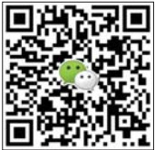
扫码加微信投稿 期待您的佳作

“自来水”是我们生活中最熟知的刚需品,但它背后的故事却鲜为人知。为挖掘、展现水务人如何保障供水、服务社会的点点滴滴,济南水务集团日前启动了第二届“记忆·泉城自来水”摄影大赛。与此同时,山东省新闻摄影学会暨齐鲁晚报·齐鲁壹点济南水务集团影像工作站也挂牌成立。此次大赛吸引了众多水务集团的职工、通讯员以及社会摄影爱好者积极参与,大赛共收到摄影作品400余幅,其中不乏“大片”,精品佳作震撼心灵。摄影师们用镜头诠释了水务员工对泉城的无私奉献和对生活的热爱。 山东省新闻摄影学会暨齐鲁晚报·齐鲁壹点济南水务集团影像工作站供稿