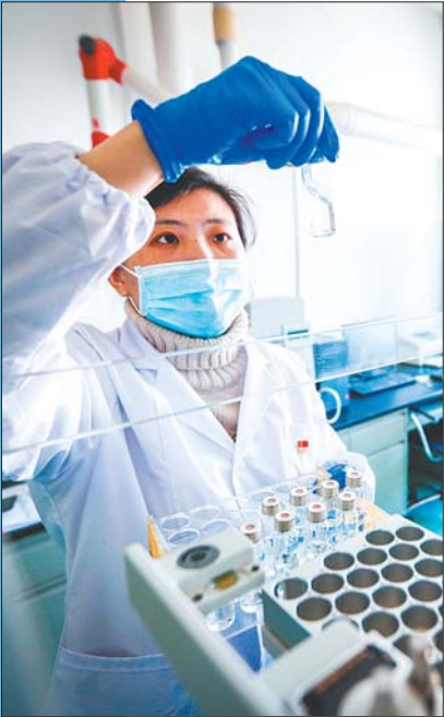
一等奖 一丝不苟