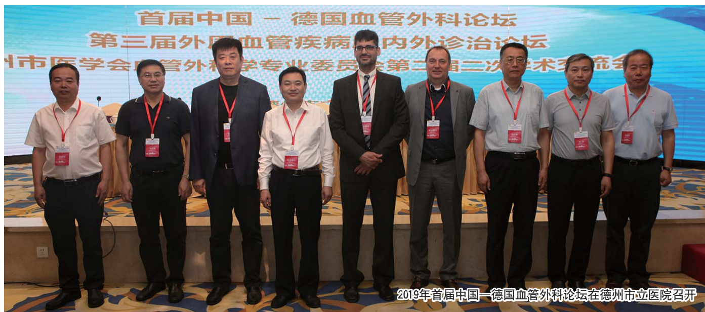
2019年首届中国-德国血管外科论坛在德州市立医院召开