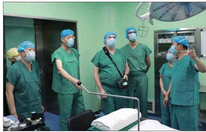
两位德国专家在德州市立医院手术室参观指导