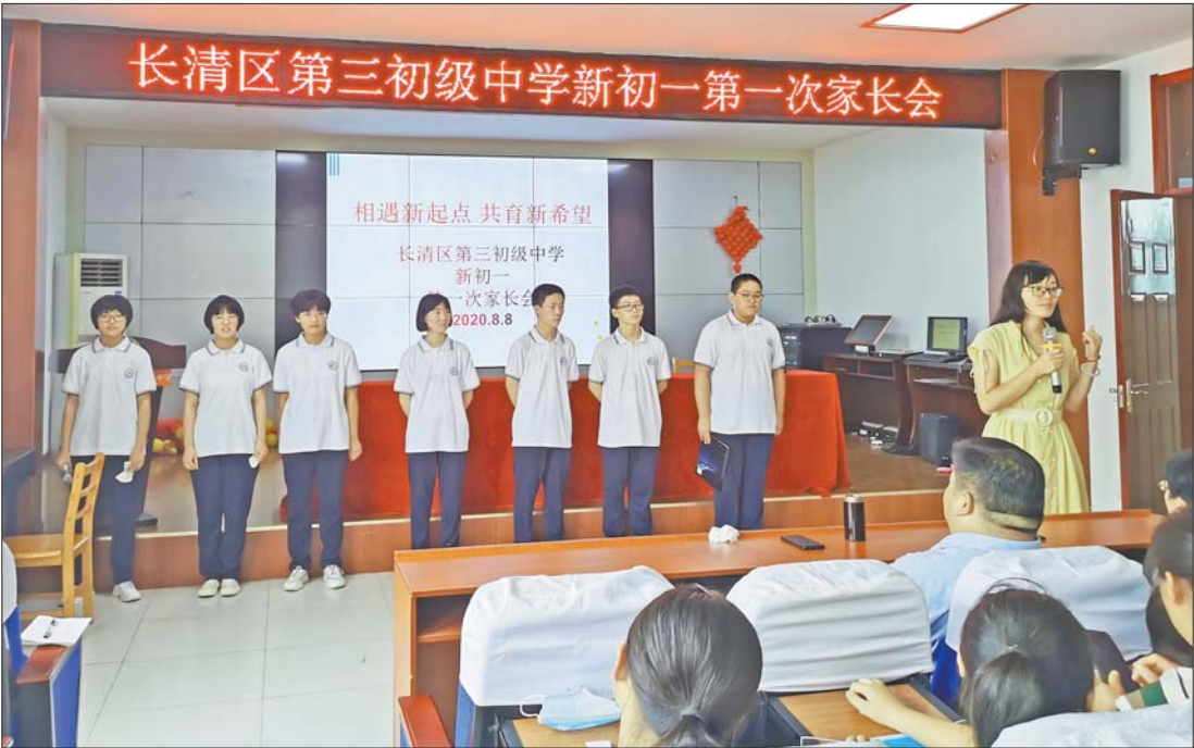
长清区第三初级中学新初一“家校共育工程”正式启动。

本报8月13日讯(记者于梅通讯员 颜娜) 教育工作不仅是校内教育,校外家长的配合也很重要。只有家庭教育和学校教育密切配合,形成合力,才能促进青少年的健康成长。近日,长清区第三初级中学举办了暑假初一家长会,这次家长会的召开,标志着新初一“家校共育工程”的正式启动。