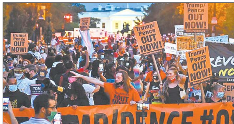
27日晚，白宫外面的街道上聚集着大量高呼“下台”口号的特朗普反对者。