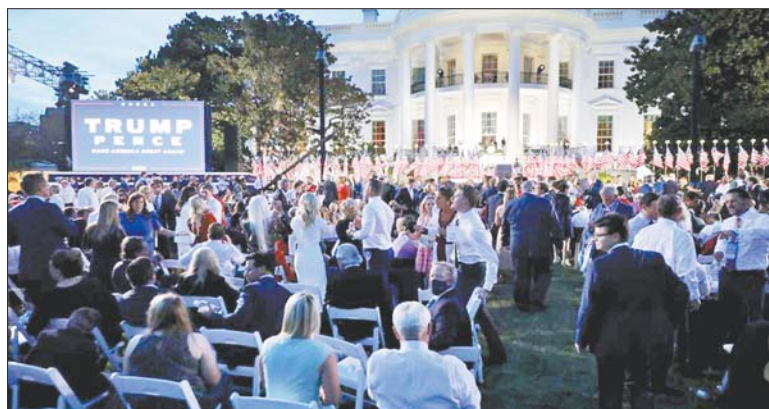
27日晚，千余名特朗普的支持者在白宫南草坪等待特朗普发表接受提名的演讲。

在27日晚接受党内提名的白宫演讲中，特朗普也坦言，美国两党或民众“在意识形态、处世哲学和未来愿景方面从未像如今这样对立”。为了确保特朗普顺利发表讲话，白宫建筑群周边提前架起了围栏，里面是上千拥趸，外边是高喊口号的反对者。