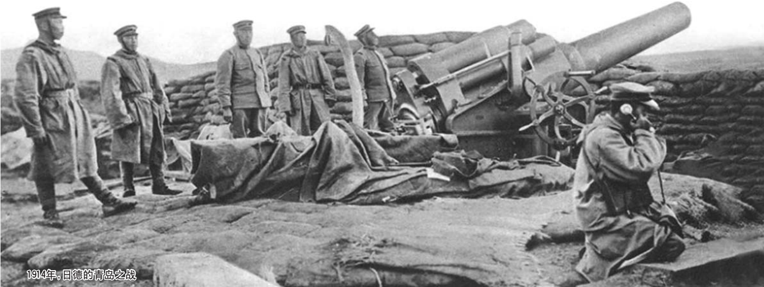
1914年，日德的青岛之战

亚洲国家有很多相似点，而且许多亚洲国家有着相似的文化，比如受汉语文化圈、儒家和佛教熏陶，许多亚洲国家在历史中互相有着亲近感。然而，多年来，亚洲从来没有形成一个共同的亚洲价值，或形成亚洲共同体。徐国琦认为，这与一战以来区域内的军事和意识形态冲突直接关联，只有吸取历史的经验教训，看到共有的历史，亚洲各国才能共创一个共同的未来。