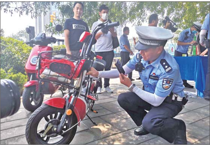
电动自行车集中挂牌进入倒计时,每天都有不少人挂牌。

按照省政府相关规定,电动自行车集中登记挂牌截止日期为8月31日。为此,2020年9月1日